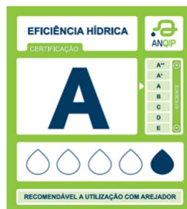
Exemplo de etiqueta para torneiras de lavatório e de cozinha