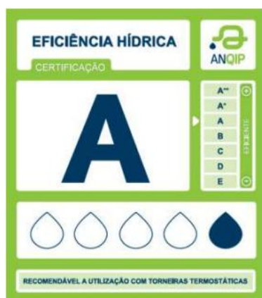
Exemplo de etiqueta para sistemas de duche ou só cabeça de duche

A nível europeu não existem requisitos mínimos obrigatórios para estes produtos, embora esteja em criação, o rótulo unificado europeu, de carácter voluntário, que agregará vários rótulos nacionais, entre os quais o português, da responsabilidade da ANQIP. A transição deste rótulo voluntário numa etiqueta com regulamento obrigatório está ainda em fase de preparação e, a nível nacional, para efeitos de candidaturas a apoios financeiros de melhoria da eficiência energética, por exemplo, o único rótulo válido é o de eficiência hídrica da ANQIP.